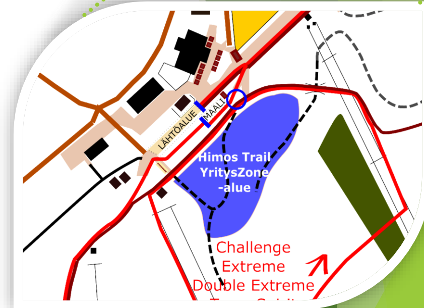
Alustava suunnitelma - Oikeudet muutoksiin pidätetään